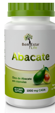
Óleo de abacate